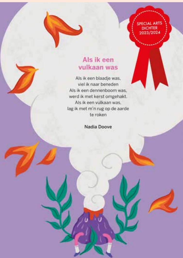
Ontwerp: Maren Bruin